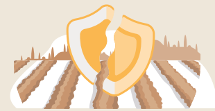
MALAS CONDICIONES DE TRABAJO

En este contexto, los países deben contar con políticas públicas y legislación nacional de donde se deriven planes, estrategias y programas a fin de abordar estos aspectos y desarrollar acciones orientadas a fortalecer la caficultura con un enfoque de derecho y sustentabilidad ambiental. Respondiendo a esta necesidad se ha planteado la elaboración de este estudio de análisis legislativo, de políticas públicas, acuerdos nacionales e internacionales ratificados por Guatemala, Honduras y El Salvador, relacionadas a fomentar el desarrollo de la cadena de valor de café con un enfoque social, económico y ambiental. Este análisis estará orientado a promover el empleo digno y libre de trabajo infantil, y equidad de género; siendo el propósito identificar vacíos existentes en las políticas y leyes vigentes en cada país, en el tema de aplicación de la equidad e inclusión social y de género, protección de la niñez contra el trabajo infantil, condiciones laborales, sostenibilidad ambiental, cambio climático y las estrategias de reactivación económicas.