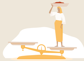
MARGINACIÓN DE GÉNERO